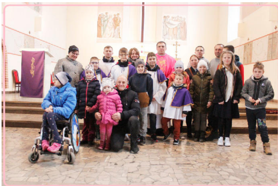
DODATKOWA MSZA ŚWIĘTA Z DZIEĆMI