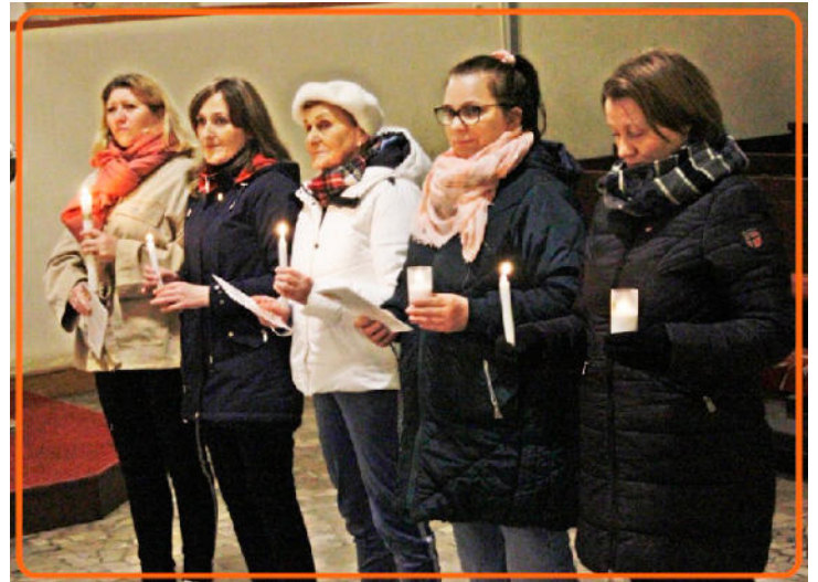
PRZYJĘCIE DUCHOWEJ ADOPCJI